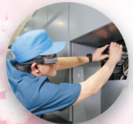
RMGT 遠隔支援システム