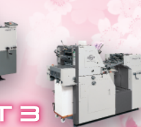
A3 判自動両面オフセット印刷機 RMGT 340PCX-2